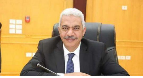
فضيلة أ.د: محمود صديق نائب رئيس الجامعة للدراسات العليا والبحوث